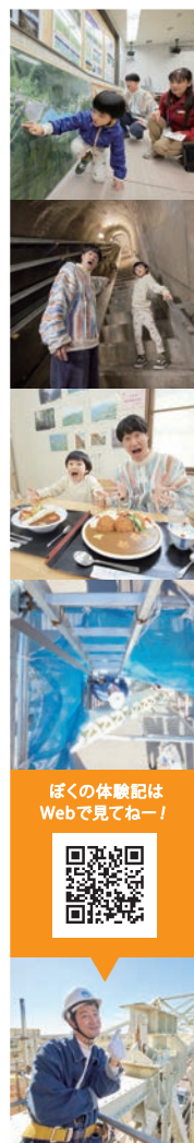
三国川ダム 南魚沼市